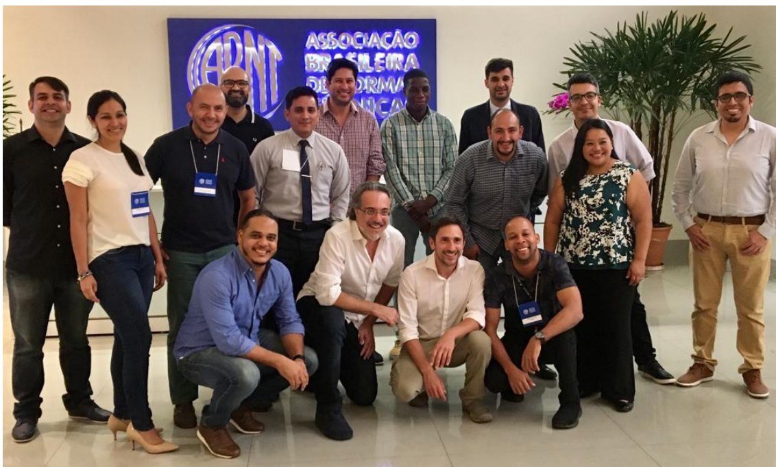
Participantes de la III Pasantía de Herramientas de TI para Normalización de COPANT 2019

Este entrenamiento contó con la participación de 16 representantes de 12 ONN de los siguientes países: Argentina, Bolivia, Colombia, Ecuador, Guatemala, Guyana, Honduras, Jamaica, Paraguay, Perú, República Dominicana y Uruguay.