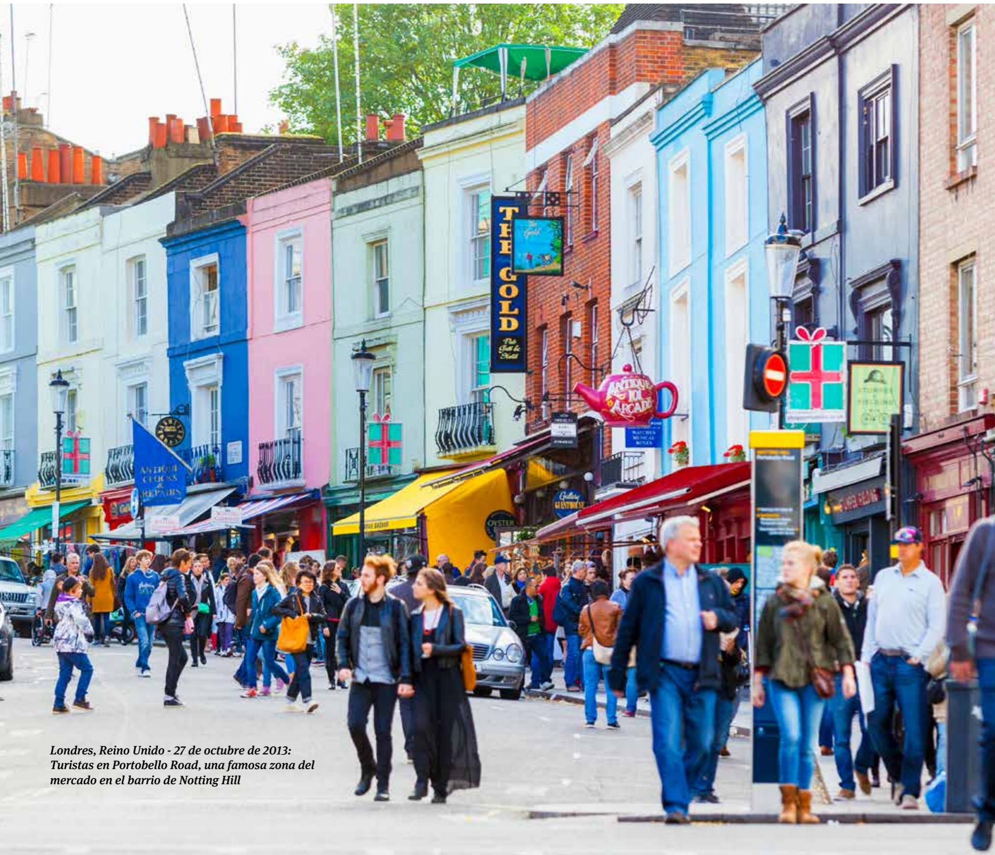
Londres, Reino Unido - 27 de octubre de 2013: Turistas en Portobello Road, una famosa zona del mercado en el barrio de Notting Hill

En todo el mundo, el sector de las pequeñas y medianas empresas (PYMES) es un motor fundamental para la innovación y la creación de empleo. Entender los retos y las oportunidades reales que conforman el futuro de las PYMES es por tanto una cuestión de la mayor importancia.