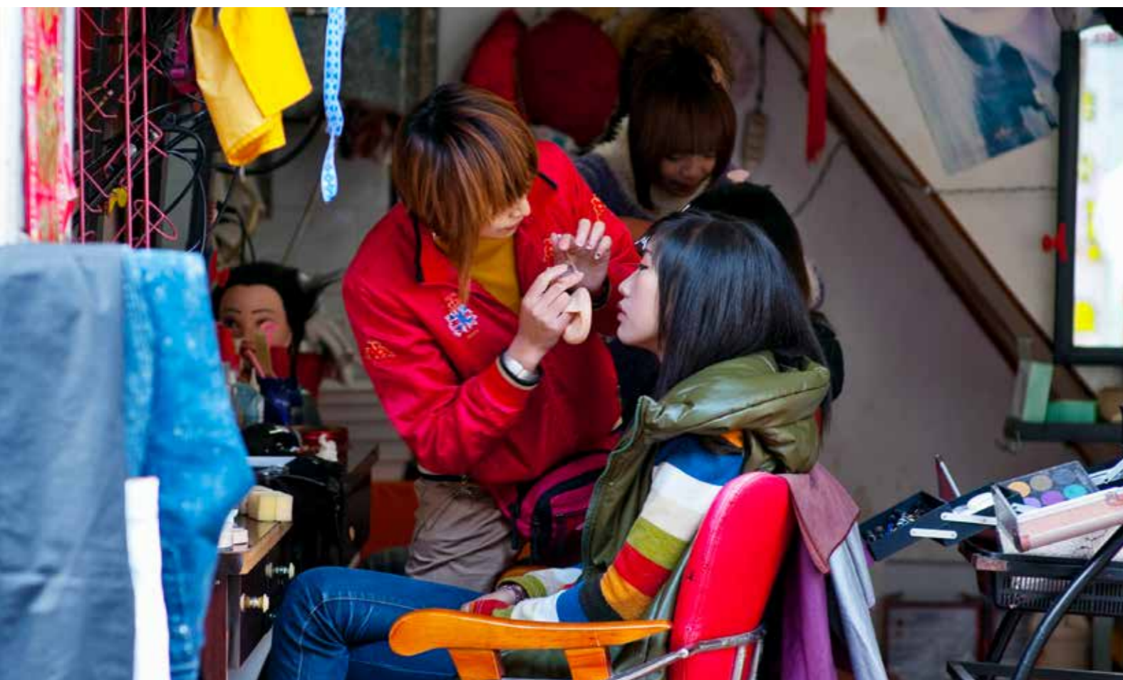
Micro Salón de belleza en el suburbio de Dali, provincia de Yunnan, China.

Los principales beneficios de la participación incluyen visibilidad, comprensión en profundidad, innovación, ventaja competitiva, posibilidades de establecer redes, y oportunidades para acceder a clientes potenciales. En otras palabras, al no participar en el proceso de decisión de la normalización se cede ante la competencia.