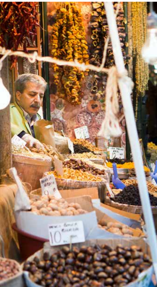
Un puesto de venta en el mercado es una de las pequeñas empresas más comunes. En esta foto: el Mısır Çarşısı (bazar egipcio) en Estambul, Turquía.

Entonces, ¿cuál es la mala noticia? Una serie de estudios recientes han relacionado la baja representación de las PYMES en la normalización con obstáculos tales como el tiempo, el personal o los recursos financieros. Según el Panel Alemán Normalización 2014, un informe sobre cómo las empresas llevan a cabo sus actividades de normalización y aplican las normas, las pequeñas empresas se ven obstaculizadas por las limitaciones financieras que impiden a muchas de ellas tomar una parte activa en la elaboración de las normas.