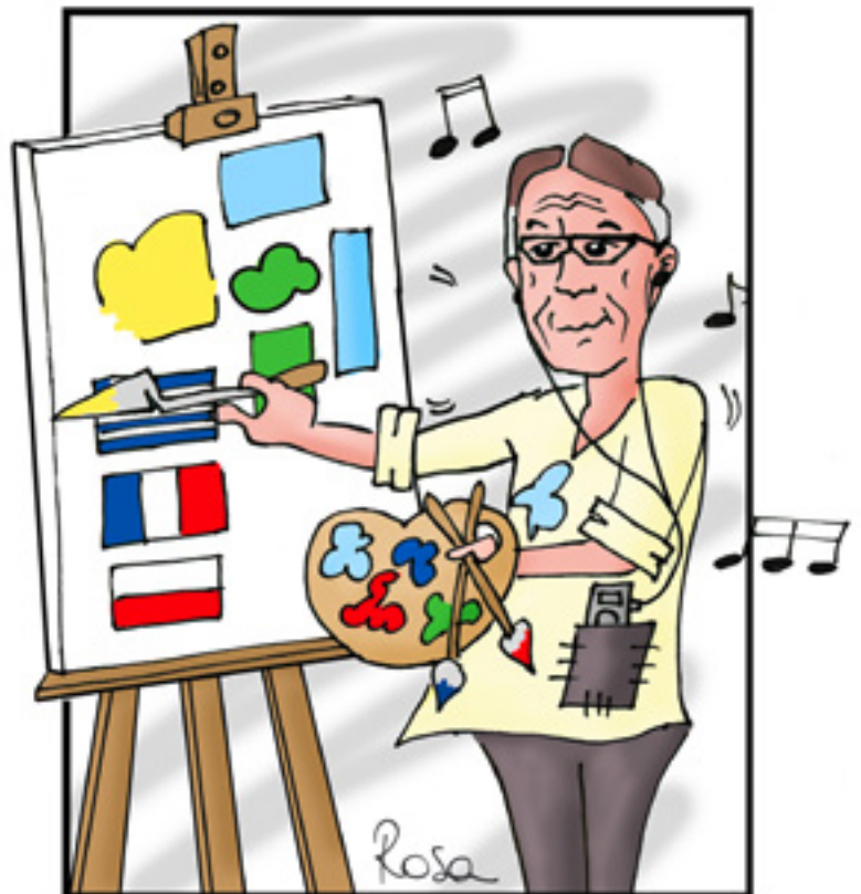
Michael Møller, Director General Interim de la Oficina de la ONU, Ginebra.